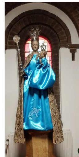
Maria van de May, op Kerstavond 2025 in haar kapel geplaatst.

De voorbereidingen zijn haast afgerond, een vrijwilligersgroep gaat zorg dragen voor het openen en sluiten, Maria staat al op haar console en vanaf 1 februari a.s. is de Mariadagkapel van de Maria Magdalenakapel aan de Kloosterstraat te Made dagelijks open om een kaarsje aan te steken, een Wees Gegroet te bidden, wat in het intentieboek te schrijven of om zo maar eens een poosje te verwijlen bij Onze Lieve Vrouw van de May. Het heeft 'even' geduurd, maar dan is zij echt terug op de May en is er dus daar, net als op Hooge Zwaluwe, Terheijden en Wagenberg, een Mariadagkapel.